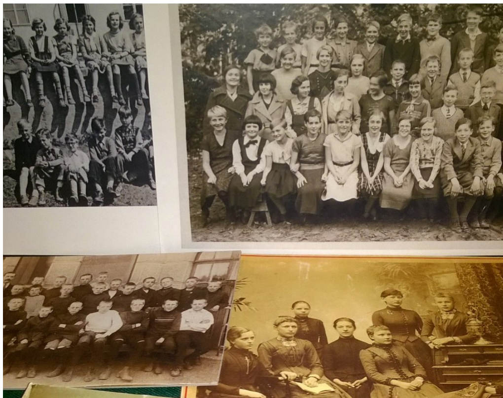
KUVA 1: "Skolväskan -arkistopedagogiikan tehtävässä koululaiset saavat vertailla eri aikakausien luokkakuvia."

Arkistopedagogisena tehtävänä Skolväskan on suunnattu yläasteikäisille koululaisille. Sen tehtävissä entisajan koulunkäyntiä pyritään liittämään suurempiin yhteiskunnallisiin muutoksiin. Oppilaat tekevät tehtävät luokkahuoneissa, pienryhmissä opettajan johdolla. Yhteensä kolmen osatehtävän tekemiseen menee noin kaksi tuntia. Arkistosalkkuja on kaksi, ja SLS lainaa niitä kouluille, toisin sanoen oppimisympäristö on koulu (Laitinen 2015).